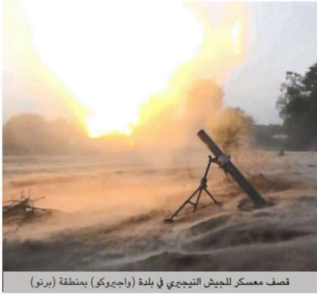
قصف معسكر للجيش النيجيري في بلدة (واجيروكو) بمنطقة (برنو)

The soldiers of the Caliphate in the Western-Africa Province this week attacked an army camp in north-eastern Nigeria. In detail: by the grace of God Almighty, on Sunday, 17 Jumada al- 'Ula, the soldiers of the Caliphate attacked an army camp of the unbelieving Nigerian army in the village of (Wagiroko) in the area of (Borno), with five mortar shells. Pictures shared by ISWAP's media branch showed the impact. Last week the soldiers of the Caliphate already killed and wounded a number of Nigerian soldiers, attacked an army camp and destroyed their equipment in three separate attacks in the area of (Borno) in north eastern Mali.